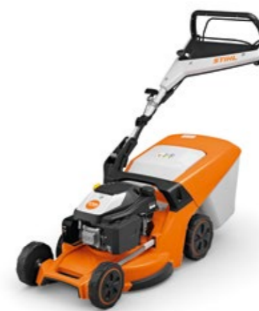
NY - TILGJENGELIG FRA VÅREN 2024 RM 448 V