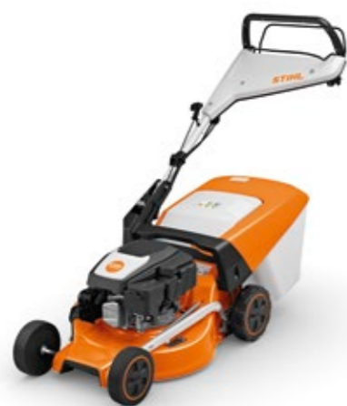
NY - TILGJENGELIG FRA VÅREN 2024 RM 248 T