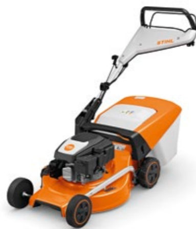
NY - TILGJENGELIG FRA VÅREN 2024 RM 253 T